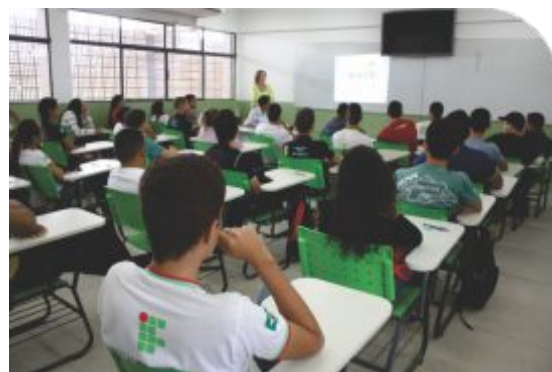
Estudantes do IF Sertão-PE participam de processo seletivo para estágio em empresa da região do Vale do São Francisco

Ainda em 2012, o IF Sertão-PE tornou-se a primeira instituição de ensino do interior do Nordeste a realizar o teste de proficiência TOEFL, exame que avalia as habilidades do candidato em língua inglesa, principalmente em nível acadêmico. Reconhecido internacionalmente, o TOEFL é utilizado por diversas instituições e organizações estrangeiras como critério de seleção, tanto para estudantes como profissionais que desejam participar de programas de intercâmbio e cooperação internacional.