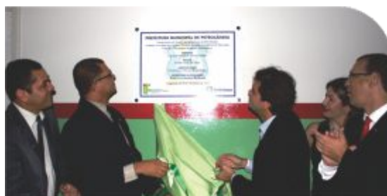
Representantes do IF Sertão-PE e do município de Petrolândia descerram a placa de inauguração do Centro de Referência

área total de 14 hectares, com 1.200 metros quadrados construídos mais quadra poliesportiva, e encerrou o ano com 700 estudantes atendidos em 21 cursos de Formação Inicial e Continuada (FIC) e cinco cursos técnicos regulares oferecidos no âmbito do Pronatec (Agropecuária, Segurança do Trabalho, Aquicultura, Informática e Química). Já o Centro de Referência de Afrânio oferece, além de capacitações na modalidade FIC, os cursos técnicos subsequentes de Agroindústria, Informática e Zootecnia.