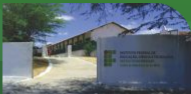
10 Centro de Referência de Sertânia