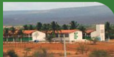
9 Centro de Referência de Petrolândia