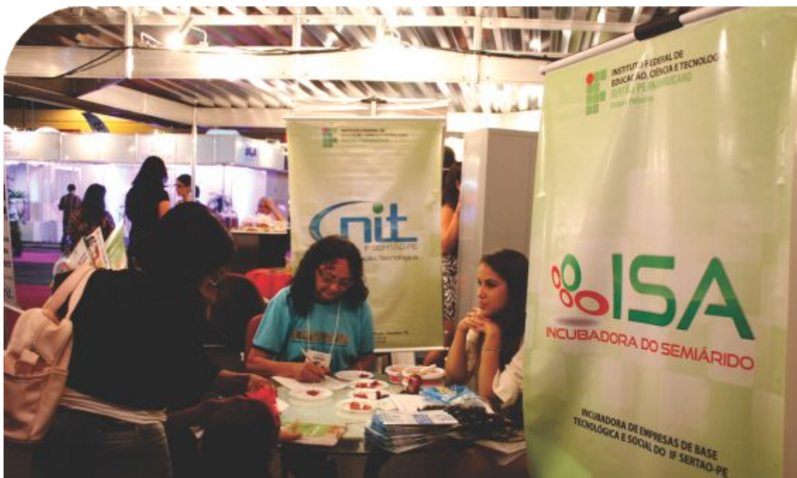
Equipes do NIT e da ISA participaram da 25ª Feira Nacional da Agricultura Irrigada (Fenagri), realizada em Petrolina-PE em 2014