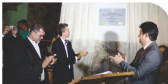
Momento de descerramento da Placa identificadora do Centro de Referência Sertânia na Escola Sebastião Lafayette

Também foi inaugurado, em novembro passado, e está funcionando a todo vapor o Centro de Referência de Petrolândia, administrado pelo campus Floresta do IF Sertão-PE . O mais novo ponto de presença do Instituto tem