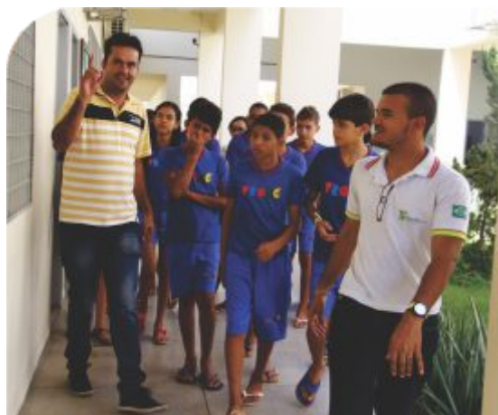
Participantes do projeto de extensão Agentes Literários realizam visita ao câmpus Salgueiro e participam de atividades educativas

Entre os objetivos da extensão no instituto, destacam-se a criação de mecanismos de integração entre o saber acadêmico e o saber popular, buscando uma