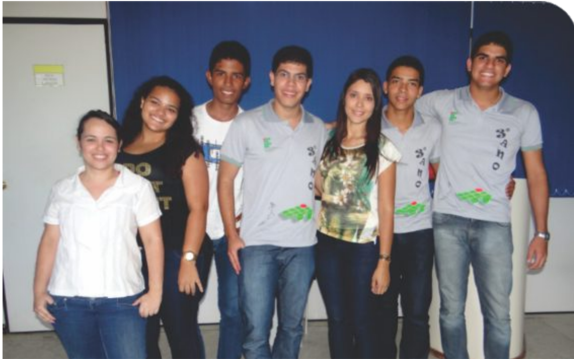
Sete alunos do IF Sertão-PE foram selecionados para realizar um estágio de 18 meses na empresa Amazon Produce Network, nos Estados Unidos