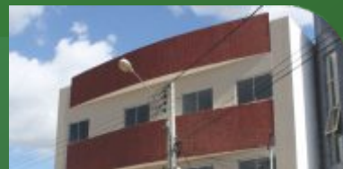
R Reitoria anexo 1