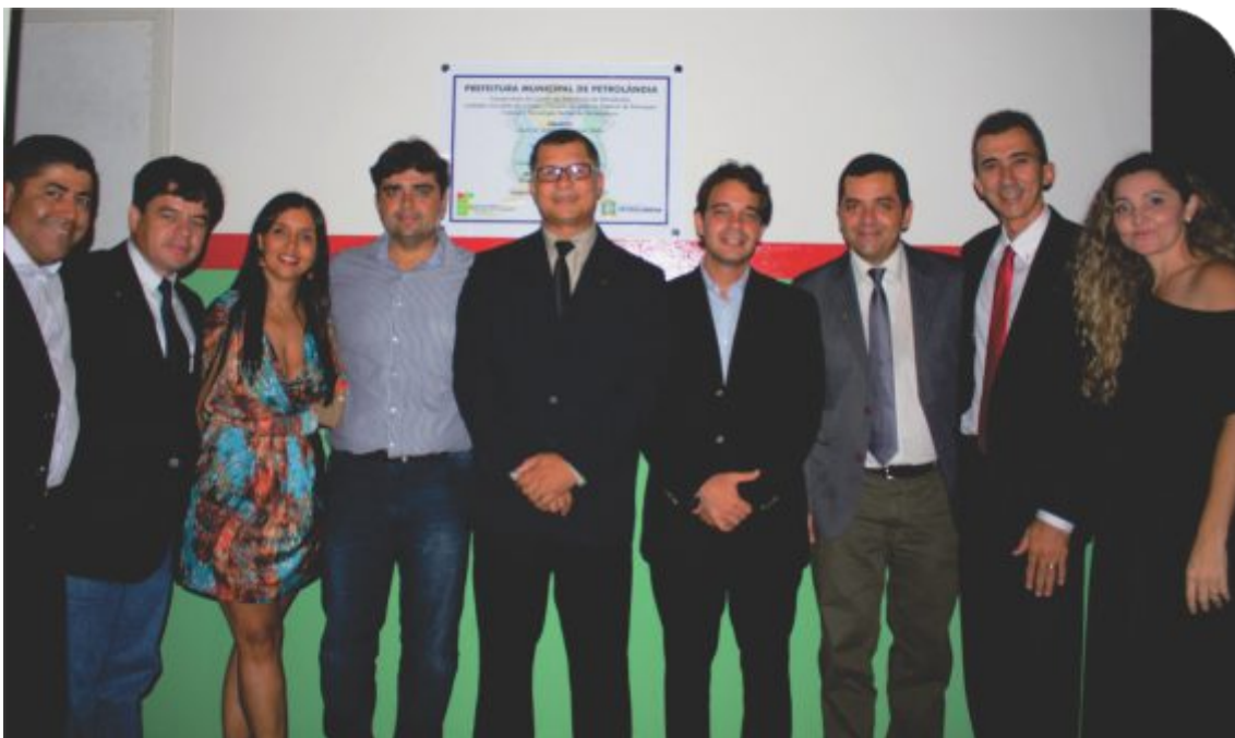
Cerimônia de inauguração do Centro de Referência de Petrolândia