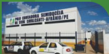
8 Centro de Referência de Afrânio