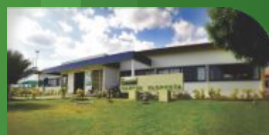
3 Câmpus Floresta