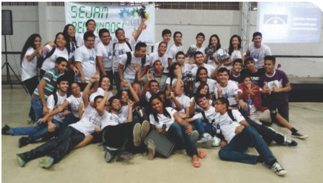
Equipe do IF Sertão-PE , durante a Olimpíada de Robótica

Os estudantes do IF Sertão-PE também conseguiram bons resultados na etapa nordestina dos Jogos dos Institutos Federais (JIFs), realizada entre os dias 25 e 29 de agosto, em Teresina-PI. A comitiva, composta por 69 atletas estudantis, foi acompanhada de cinco servidores do Instituto. Ao término da competição, quinze estudantes classificaram-se para a etapa nacional dos JIFs.