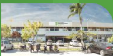
1 Câmpus Petrolina