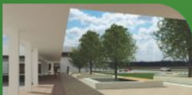
7 Câmpus Santa Maria da Boa Vista