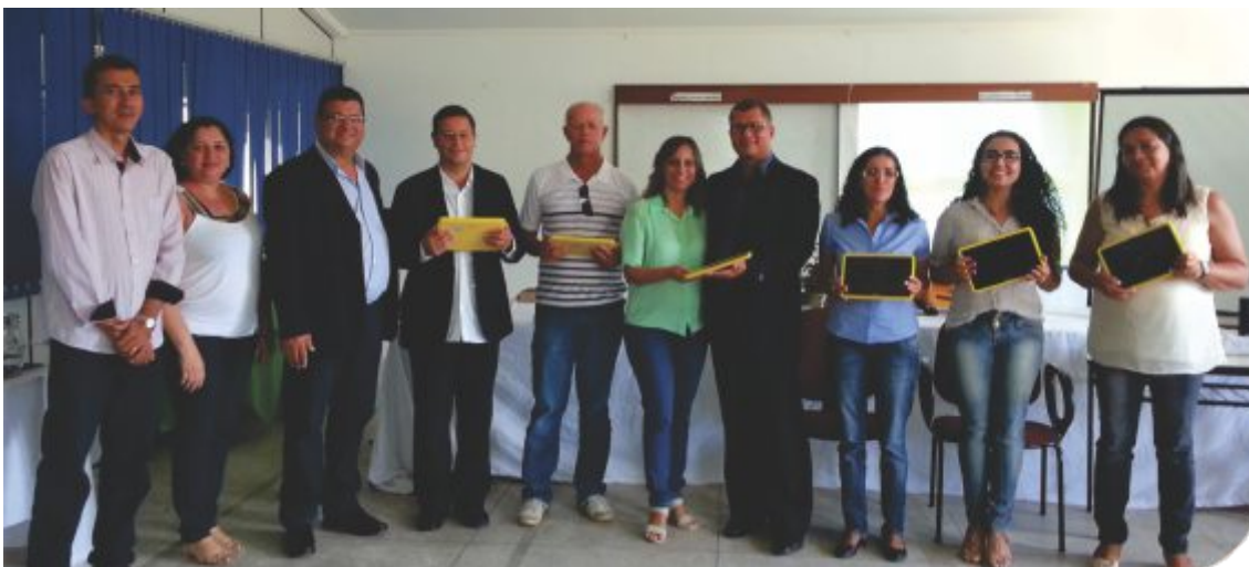
Docentes do câmpus Petrolina Zona Rural recebem tablets