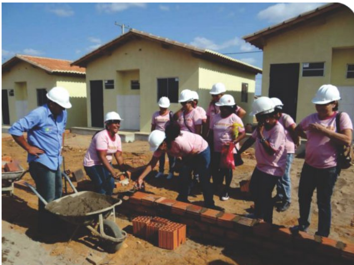
Em 2014, centenas de alunas do programa Mulheres Mil receberam a certificação em cursos oferecidos pelo IF Sertão-PE

Outra iniciativa semelhante que merece destaque é o Programa de Apoio ao Desenvolvimento Rural Sustentável de Pernambuco (Prorural), que tem como meta atender organizações de produtores familiares através da oferta de cursos de capacitação profissional e outras atividades. As ações do Prorural têm sido desenvolvidas pelos câmpus Petrolina Zona Rural e Santa Maria da Boa Vista e contemplam os seguintes municípios do Território Produtivo do Sertão do São Francisco: Petrolina, Dormentes, Afrânio, Lagoa Grande, Santa Maria da Boa Vista, Orocó e Cabrobó.