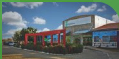
5 Câmpus Ouricuri