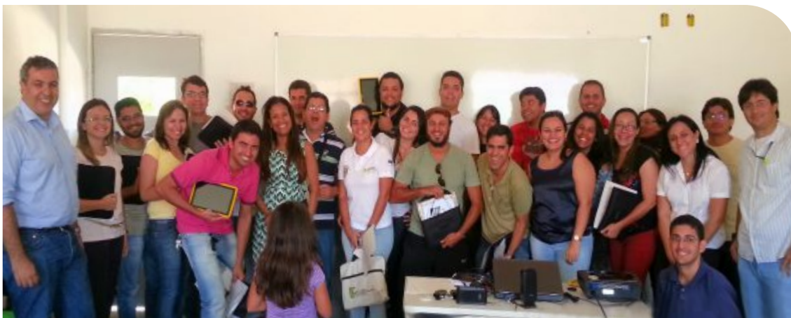
DGTI entrega tablets a docentes do câmpus Ouricuri