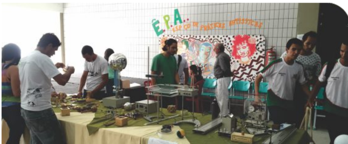
Mostras didáticas fizeram parte da programação da 2ª JID

*O curso superior de Licenciatura em Música, por exigir habilidade específica, é o único que possui um processo seletivo específico e não faz parte do Sisu.