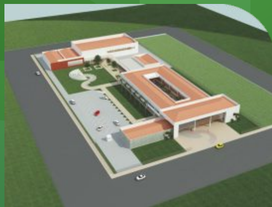
Futuras instalações dos câmpus Serra Talhada e Santa Maria da Boa Vista