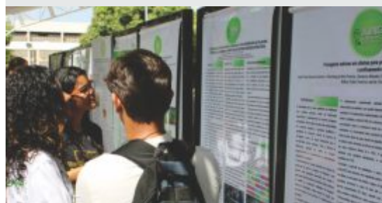
Sessão de pôsteres dos projetos de pesquisa e extensão do IF Sertão-PE foi um dos destaques da 9ª Jince

A Jince é um evento realizado anualmente, organizado em conjunto pelas Pró-Reitorias de Pesquisa, Inovação e Pós-Graduação (Propip) e de Extensão e Cultura (Proext). Além da divulgação dos trabalhos de pesquisa e extensão que estão sendo desenvolvidos no IF Sertão-PE , a jornada tem como objetivo promover a integração entre a comunidade acadêmica e a sociedade, por meio de atividades artísticas e culturais.