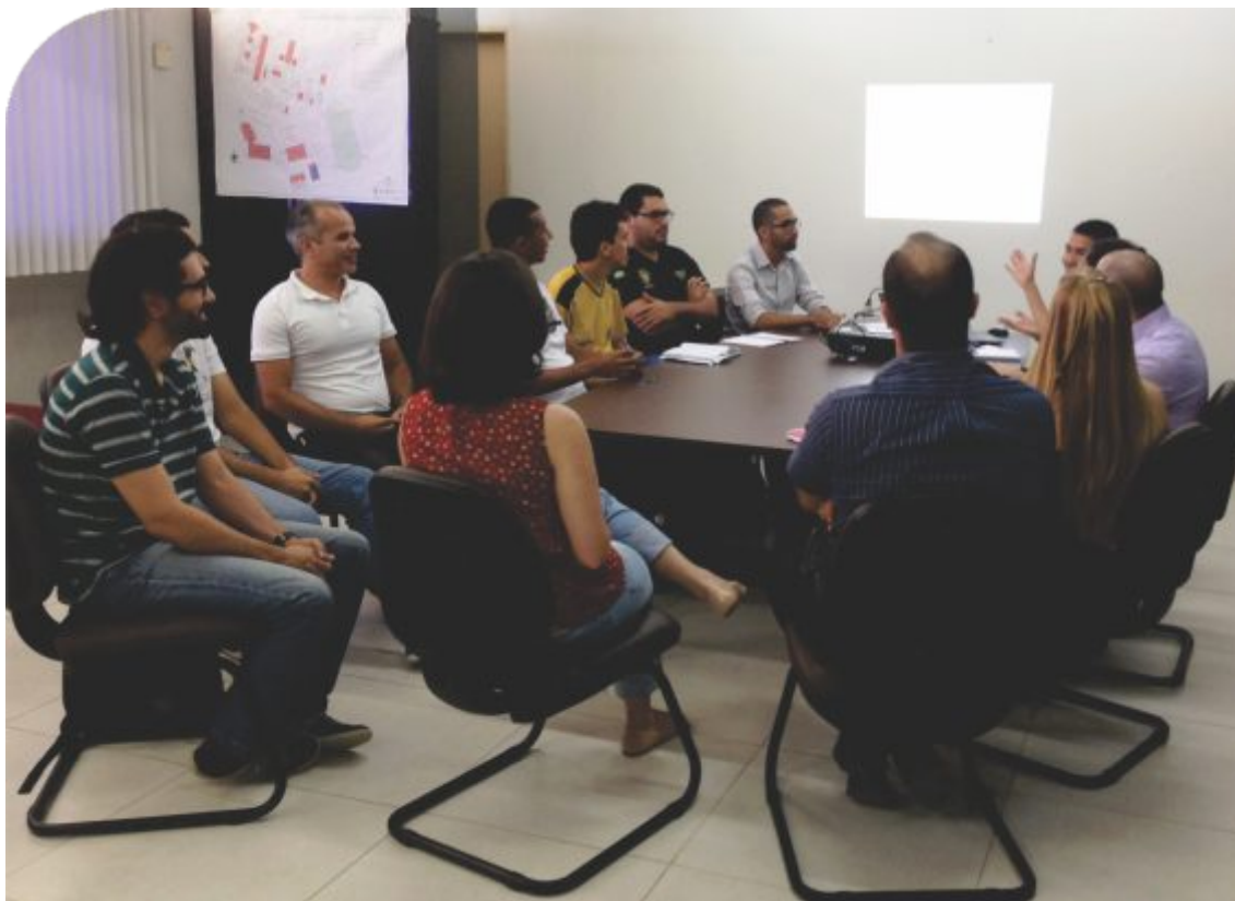
Comunicadores do IF Sertão-PE se reúnem para debater ações

Tal ampliação tem propiciado o acesso à informação como forma de concretizar o princípio constitucional da publicidade em sua acepção mais ampla. Viabilizando o diálogo aberto com a comunidade e o acolhimento das suas demandas, o trabalho realizado pela equipe de comunicação do IF Sertão-PE tem promovido o intercâmbio de experiências e informação entre os diversos públicos da instituição, possibilitando a concretização das diretrizes dos Institutos Federais.