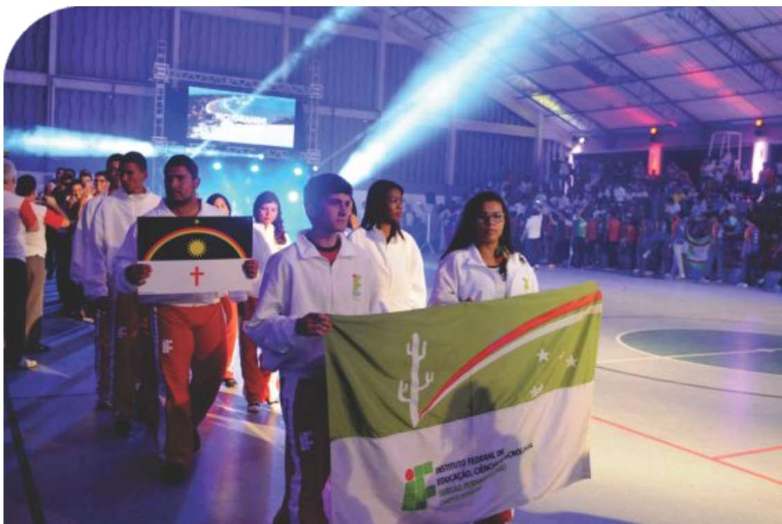
Estudantes do IF Sertão-PE na cerimônia de abertura dos Jogos dos Institutos Federais (JIFs)