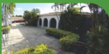
2 Câmpus Petrolina Zona Rural