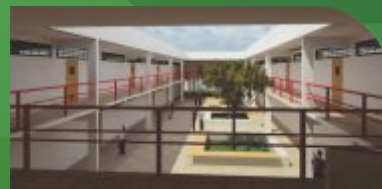
6 Câmpus Serra Talhada