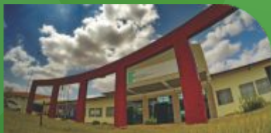
4 Câmpus Salgueiro