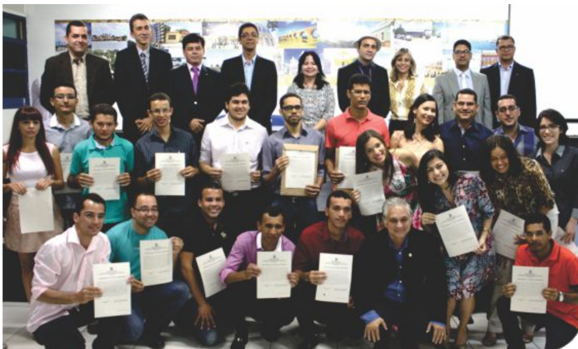
Cerimônia de posse coletiva de novos servidores do IF Sertão-PE , realizada em agosto de 2014

Tendo assumido o compromisso com a capacitação e o desenvolvimento dos seus servidores, o IF Sertão-PE enfrenta o grande desafio de implantar práticas de gestão que privilegiem o incremento de conhecimentos, habilidades e atitudes e não se limitem à aquisição de conhecimento instrumental. Acreditando que o desenvolvimento permanente do servidor público é um fator estratégico, a instituição percebe a necessidade de uma aprendizagem mais ampla, que permita o desenvolvimento não só de saberes técnicos, mas também de aspectos comportamentais e cognitivos. Ao longo do ano de 2014, foram oferecidos pela DGP 21 cursos de capacitação voltados à aquisição de um conjunto de competências essenciais não apenas às atividades dos servidores, mas também à sua qualidade de vida e melhoria no relacionamento interpessoal. Cerca de 400 servidores do IF Sertão-PE participaram dos cursos.