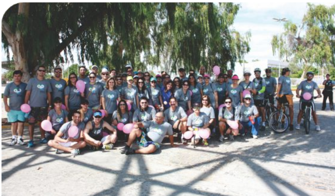
Servidores do IF Sertão-PE e da Univasf participaram do projeto Integrar para Construir