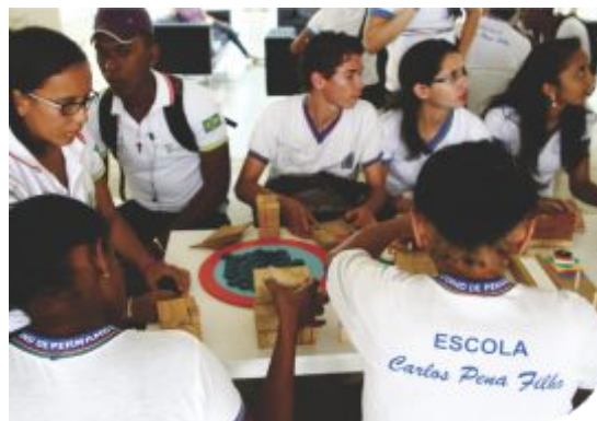
Alunos de uma escola pública estadual realizam visita ao Museu de Ciências do câmpus Salgueiro

Além do apoio a projetos de extensão, a instituição desenvolve uma série de ações que refletem o seu compromisso de transformação social. Exemplo disso é o programa Mulheres Mil, iniciativa do Ministério da Educação (MEC) que visa oferecer formação profissional e tecnológica a mulheres em situação de vulnerabilidade social, contribuindo para a promoção da igualdade de gênero através da geração de emprego e renda. Desde a sua implantação, centenas de mulheres já obtiveram a certificação em cursos profissionalizantes ofertados pelo IF Sertão-PE , com números bastante expressivos em 2014.