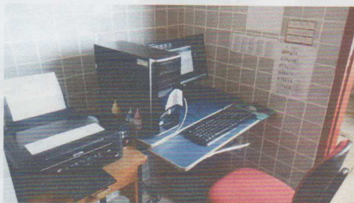
Figura 2 - Computador da secretaria da Escola.